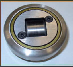
RODILLO ROLLER ROULEMENT